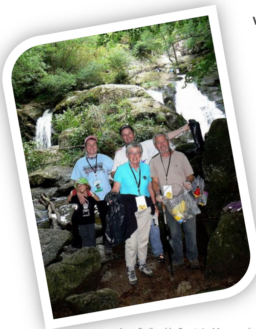
Avec Ewilund le Comtois, Morgane la Chipie, Gramille & Papouille au CITO du MEGA 3

"C'est bien là toute la magie du geocaching : l'aventure est au bout de la rue !"