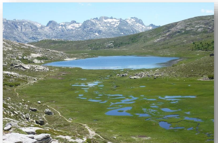
Eartcache Lac Ninu/Lake Nino, Mai 2011, Corse ( GC2BKTN )