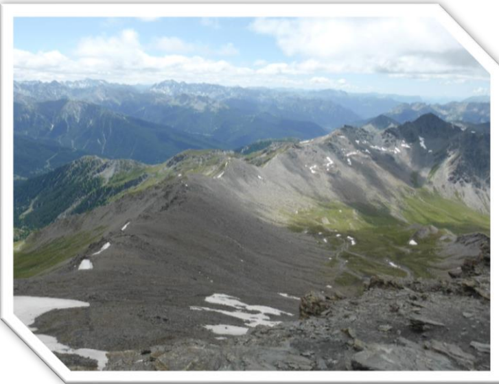
Grand Glaiza 3293m, Juillet 2014, Provence-Alpes-Côte d'Azur ( GC4J3KZ )

Le problème des reportages télévisés est qu'ils sont souvent coupés par le journaliste pour n'en garder que ce qui l'intéresse, lui. Et ce, malgré toute la pédagogie dont aura fait preuve le géocacheur pour bien présenter les