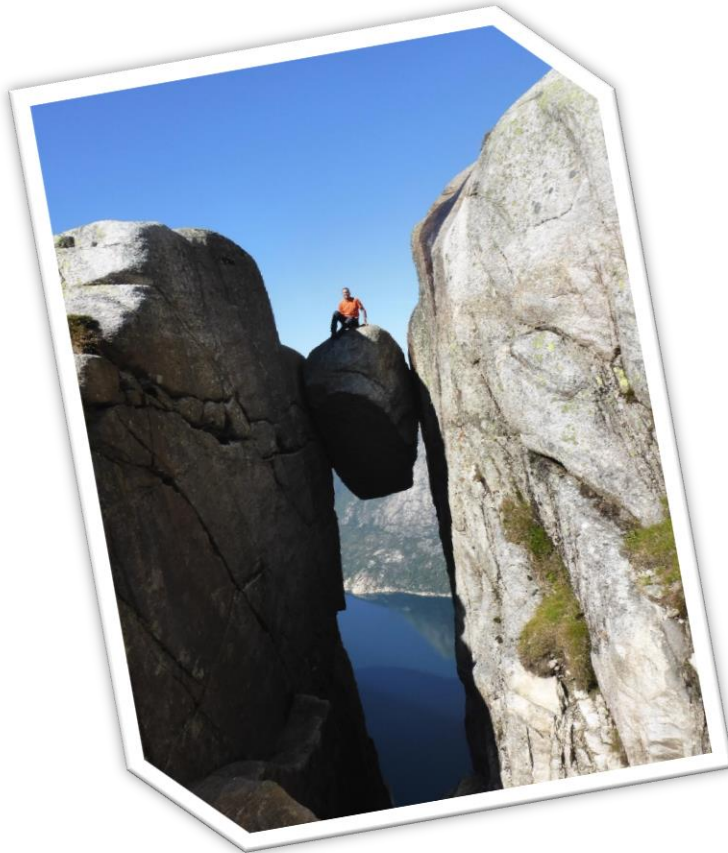
Eartcache Lysefjorden Earthcache - Kjerag and Preikestolen, Août 2014, Norvège ( GC1C6FR )

J'ai proposé également à chacun d'y contribuer, j'ai donc régulièrement des sujets proposés par d'autres géocacheurs. Cela permet à chacun de mettre en valeur tel ou tel aspect du jeu ! Contactez-moi si vous avez envie de parler d'un sujet.