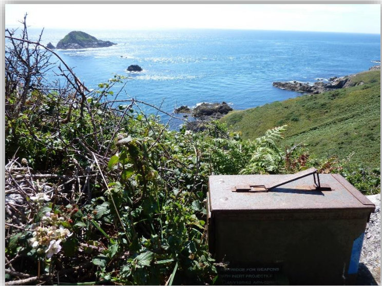
Little Sark, Août 2012, Guernsey ( GCWEE5 )

J'aime bien écrire et faire de la photo, cela s'y prête donc plutôt bien.